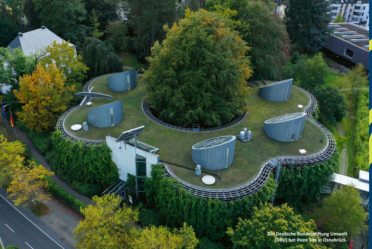
Die Deutsche Bundesstiftung Umwelt (DBU) hat ihren Sitz in Osnabrück.